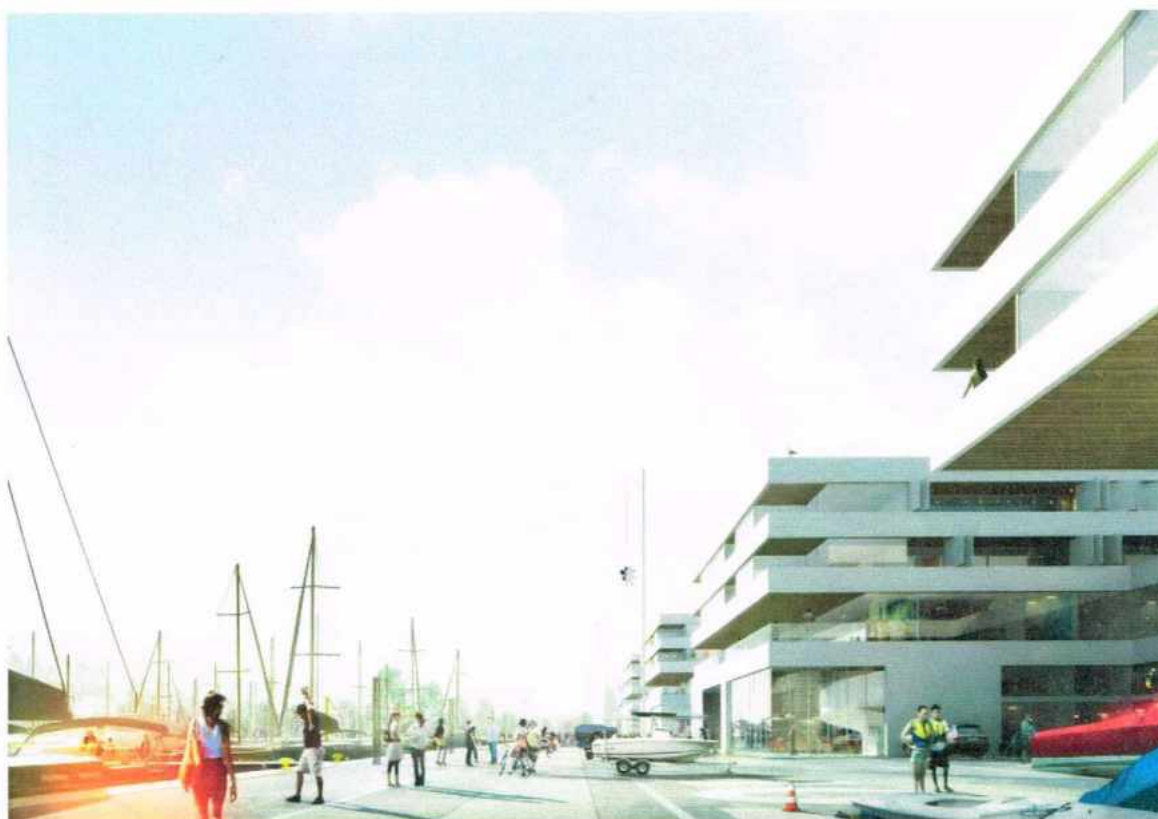
Wizualizacje od strony basenu jachtowego.