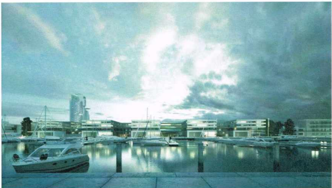
Widok od strony mariny.