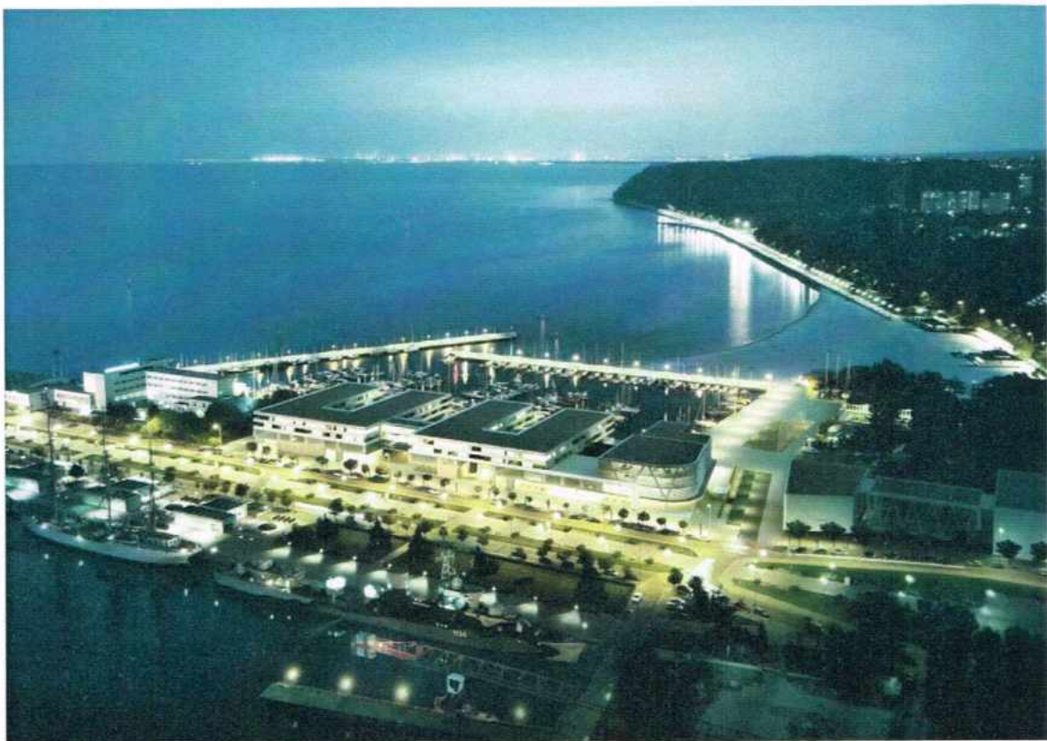
Widok na cały obiekt.