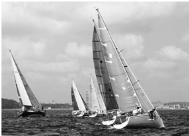
Start do regat.