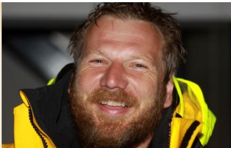
Brazylia 2011 – po 44 dniach samotnej żeglugi